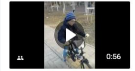
Видео от МАДОУ д/с № 78 "Гномик" г. Белгорода