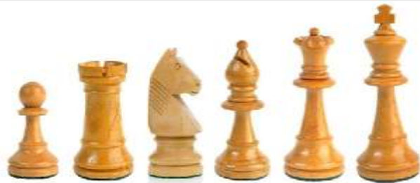
пешка ладья конь слон ферзь король

В вашей армии 16 фигур – король, ферзь (королева), 2 коня, 2 слона, 2 ладьи и 8 пешек.